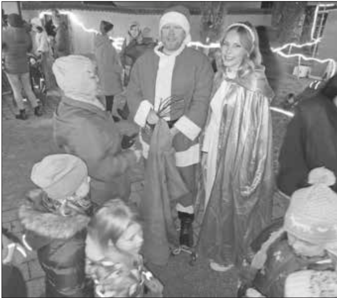
Die Gnotzheimer Kinder himmelten das Christkind und den Nikolaus an - obendrein gab es auch noch kleine Geschenke