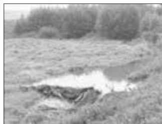
Bau eines Biberdammes an der Wurmbach - Der Biber macht es uns vor

Die Gemeinde arbeitet seit über einem Jahr an einem Hochwasserschutzkonzept, das unter anderem einen Schutzdamm in