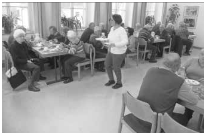
Kirchenkaffee im Gemeinderaum gut besucht