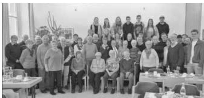
Die ELJ mit ihren Gästen

Nach den gemeinsamen abwechslungsreichen und besinnlichen Stunden wurden die Senioren mit einem Erinnerungsfoto verabschiedet, das trotz großer Altersunterschiede der abgelichteten Personen den Eindruck einer sehr homogenen Gemeinschaft vermittelt.