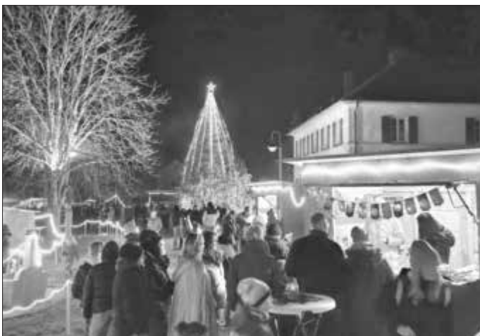
Der Gnotzheimer Weihnachtsmarkt war einmal mehr ein Besuchermagnet – der Pfarrhof ist einfach der ideale Platz und verleiht dem Markt das gewisse Etwas;