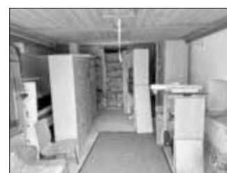
Das neue Amtszimmer / Garage im Pfarrstadel