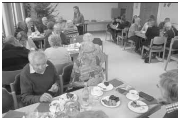
Die ELJler waren gute Gastgeber