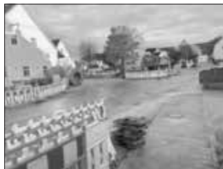
Vorbereitungen für Bauabschnitt 2 / Dorfmitte