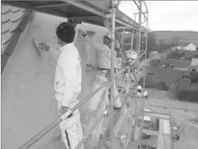
Firma Uhlig, Heidenheim, ist mit vierköpfigem Aufgebot in luftiger Höhe an der Fassade beschäftigt