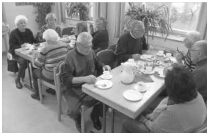
Kirchenkaffee im Gemeinderaum gut besucht