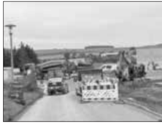
Bauabschnitt Gärtnerei Katzer

Der zweite Bauabschnitt hat bereits begonnen. In diesem Zusammenhang wurden die Arbeiten an der Glasfaser-, Nahwärme- und Wasserleitung abgeschlossen. Dadurch kann die Firma Thannhauser mit diesem Abschnitt fortfahren, ohne Rücksicht auf andere Firmen nehmen zu müssen.